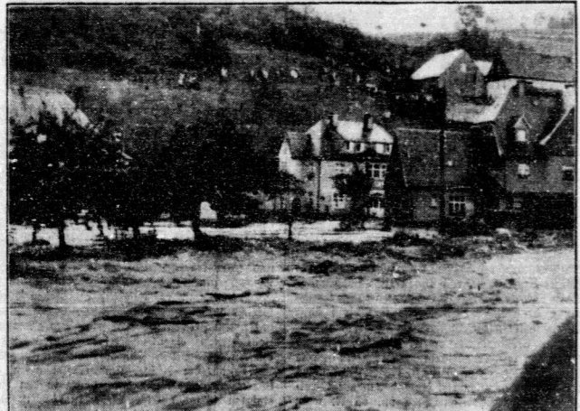
Gewitterstürme und Wolkenbrüche haben, wie berichtet, im Sächsischen Erzgebirge schwere Verwüstungen angerichtet.